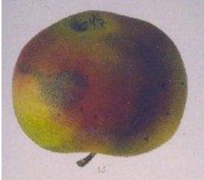
Mas , Le Verger, 1868.