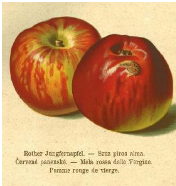
R.Stoll 1888 Pomologie

MATURITE-CONSOMMATION : Septembre-Novembre. Mi octobre-fin décembre en Crimée.